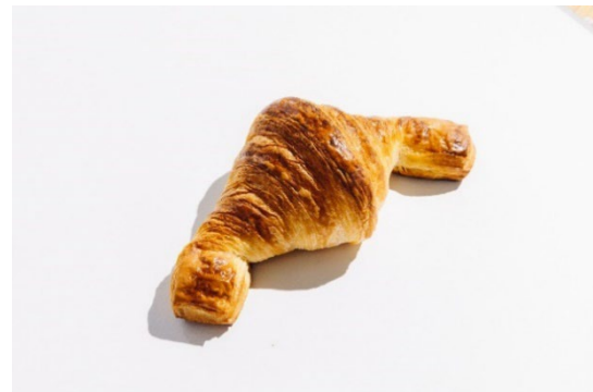
看板商品のプレミアムクロワッサン