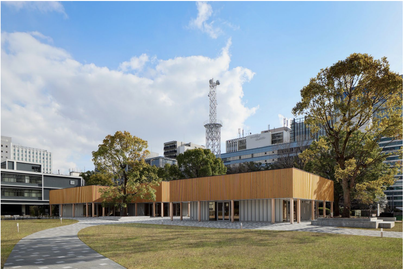
鯉城通りから施設を望む

「広島県庁舎敷地有効活用事業」(以下、本事業)を推進する事業者「MOTOMACHI CONNECT」(代表法人:NTT 都市開発株式会社、構成法人:NTT アーバンバリューサポート株式会社、デイ・ナイト株式会社、日本駐車場開発株式会社、アマノマネジメントサービス株式会社)は、広島県広島市中区基町10番50号(広島県庁舎敷地内)にて進める本事業において、このたび3つの出店テナントが決定し、2025年3月27日(木)に商業施設が開業することをお知らせいたします。