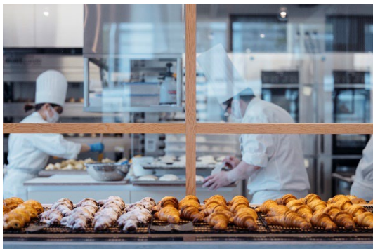
店舗内のキッチンで焼き立てのパンを提供（イメージ）