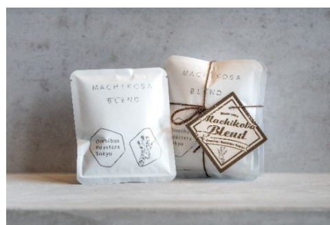
看板商品の「町工場ブレンド」