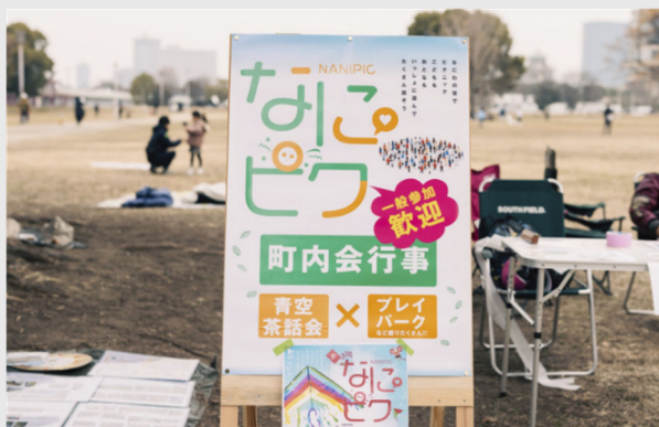
【なにサポ】 『なにピク』(町内会行事) (2025年3月29日(土))