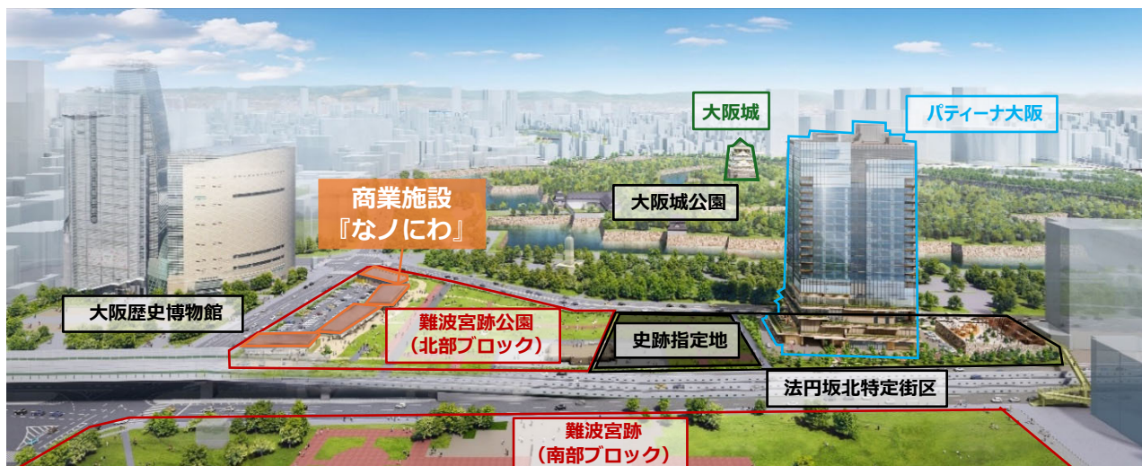
エリア全体（南側からの鳥瞰）

本物件に隣接する「法円坂北特定街区」では、2021年2月の都市計画変更以降、宿泊施設（パティナー大阪）や史跡指定地の整備を行い、大阪城・難波宮周辺エリアの「歴史・観光拠点」のさらなる発展をめざしてまいりました。パティナー大阪においては、大阪城公園や難波宮跡公園の緑地と連続した歩行者空間を整備し、街区一体で周辺との調和や回遊性を促します。