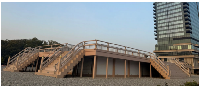
整備した後期内裏正殿