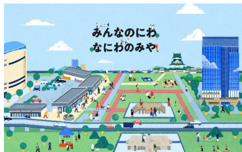
レジャーシートデザインイメージ