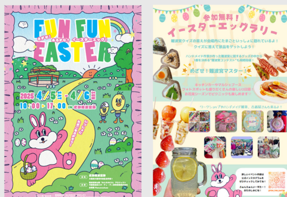
【大規模催事】 『さがせ！あるかな？イースターエッグ！FUN FUN EASTER』 (2025年4月5日(土)、4月6日(日))