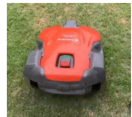
芝刈りロボットイメージ