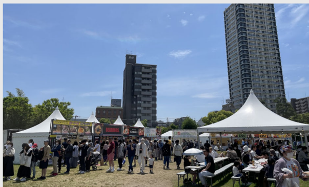
【大規模催事】 『NANIWANOMIYA WORLD KITCHEN FEST.』の様子 (2023年4月29日(土)～5月7日(日))

また、2023年度から難波宮跡（南部ブロック）において、難波宮の情報発信や賑わい創出を目的に実施してきた魅力向上業務（大規模催事・市民と連携した活動『なにサポ』※5（さまざまな市民活動を育み・サポートする取り組み）も発展させるかたちで継続実施します。