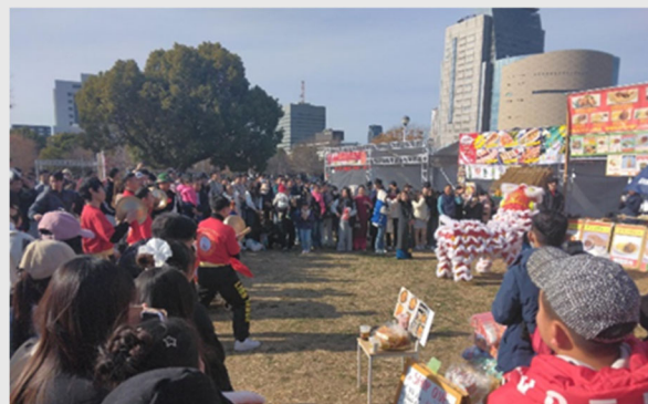
【大規模催事】 『ベトナムテト祭り』の様子 (2025年1月4日(土)、1月5日(日))