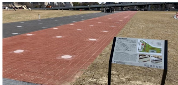
整備した回廊（赤色：前期、黒灰色：後期）・歴史解説板